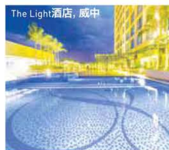
The Light酒店, 威中

這裡有各種商務等級的酒店可供選擇，鄰近的會展中心包括有檳城地下國際會展中心(SPICE)和即將在數年內竣工的檳城海濱會展中心。