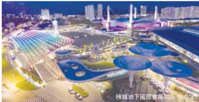
檳城地下國際會展中心 (SPICE)