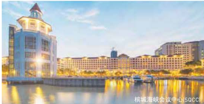
檳城海峽會議中心(SQCC)