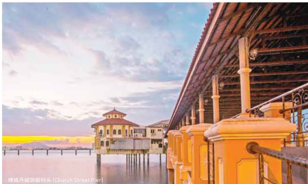
檳城丹戎遊艇碼頭 (Church Street Pier)

檳城全年都處於溫暖的熱帶氣候，一年到頭處處皆陽光普照，也因地理位置和季候風的影響，帶來豐富的降雨量。在1月及2月農曆新年期間，是全年最熱的月份；而4月至9月期間，則因西南季候風開始形成而多雨。白天氣溫平均高於30攝氏，夜間高於25攝氏。檳城的天氣無論在白天或夜晚，都非常適合在城裡漫步或騎自行車。