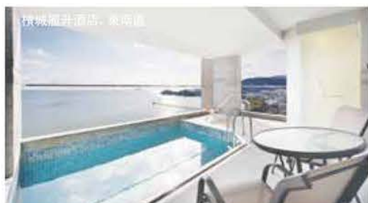
檳城福升酒店, 東南區

檳城根據不同的旅客需求及預算，從奢華酒店、精品旅館、服務式公寓至經濟酒店、海濱旅館及特色民宿，提供您不同風格系列的絕佳住宿選擇。