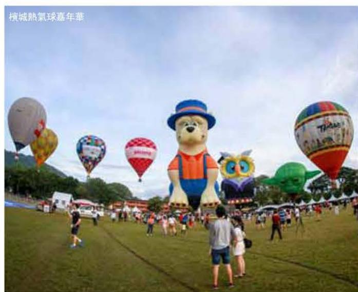
檳城熱氣球嘉年華