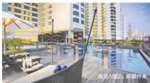
格尼G酒店, 新關仔角