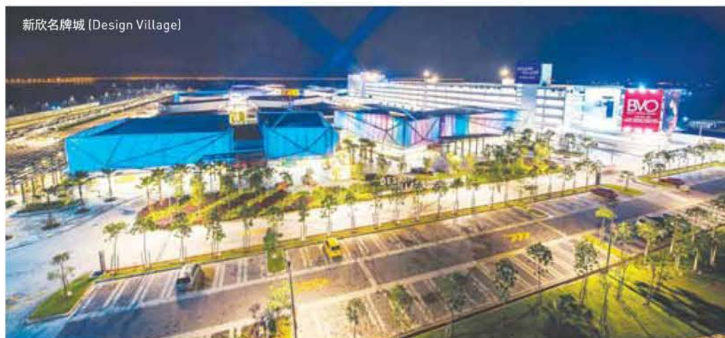
新欣名牌城 (Design Village)