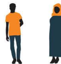
當您參觀回教堂時