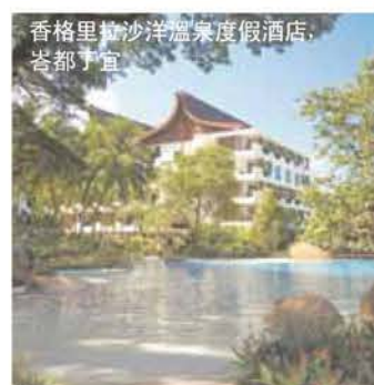
香格里拉沙洋溫泉度假酒店, 峇都丁宜