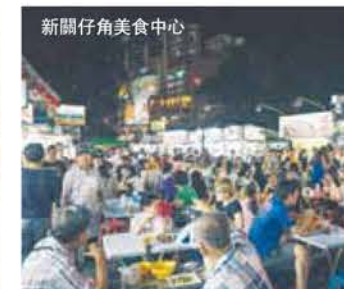
新關仔角美食中心