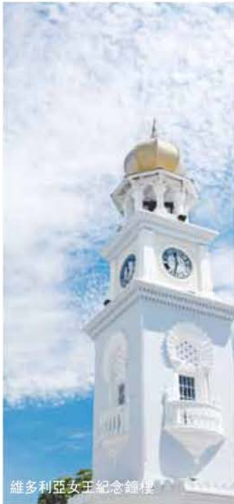
維多利亞女王紀念鐘樓