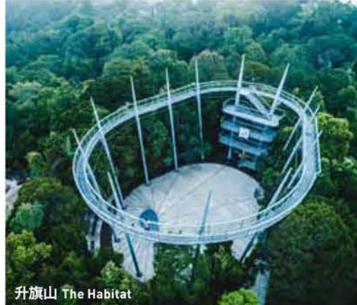
升旗山 The Habitat

Waterplay水上樂園是ESCAPE世外逃園裡最新的熱門玩點。該樂園致力透過大自然環境促進家庭間的親子樂，如今大家可體驗好玩的親子水上活動。水上樂園佔地面積為4.5公頃，園區內設有超過20種遊樂設施，其中部分更是業內首次推出的水上設施，期待值絕對滿分。