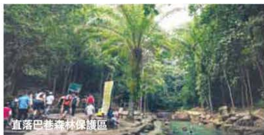
直落巴巷森林保護區