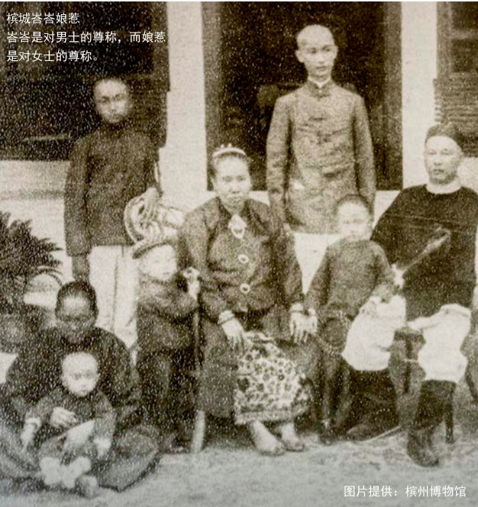
棉城峇峇娘惹 峇峇是对男士的尊称，而娘惹是对女士的尊称。