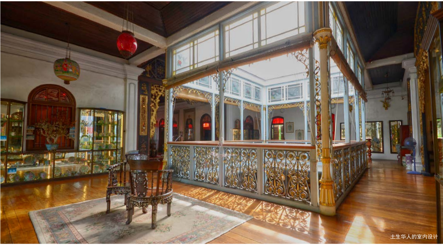
土生华人的室内设计