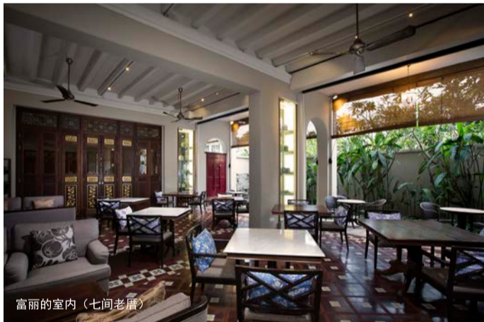
富丽的室内（七间老屋）