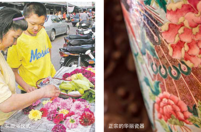
北婆罗洲仪式 正宗的华丽瓷器

曼迪邦加（花瓣浴） 中国农历的正月初一和正月十五是当地华人的黄道吉日。在此期间，娘惹准备曼迪邦加（花瓣浴），这是马来西亚的传统仪式，象征着健康和美丽，同时“冲走”噩运。