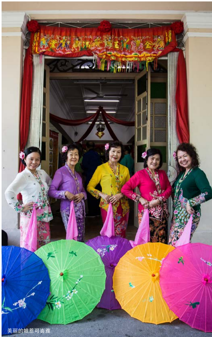
美丽的娘惹可峇雅

她们穿着精致得体；她们身着可峇雅，这是一款深受马来西亚文化影响的优雅礼服，适合大多数场合。