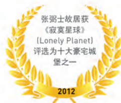
张弼士故居获《寂寞星球》(Lonely Planet) 评选为十大豪宅城堡之一