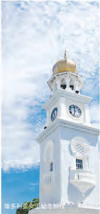
维多利亚女王纪念钟塔