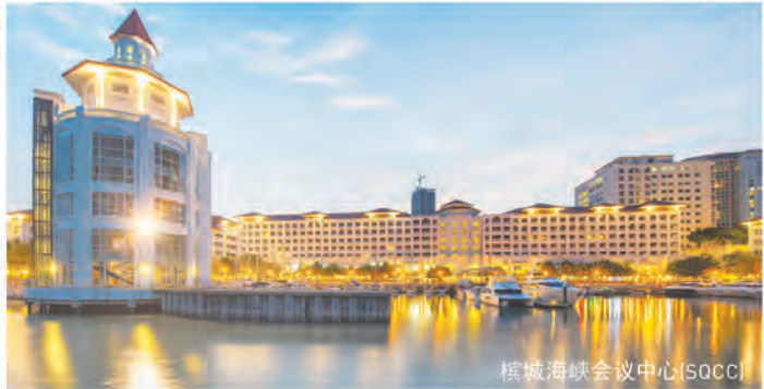
槟城海峡会议中心(SQCC)