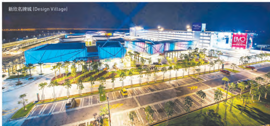
新欣名牌城 (Design Village)