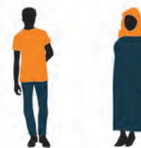
当您参观回教堂时