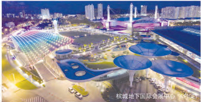
槟城地下国际会展中心 (SPICE)