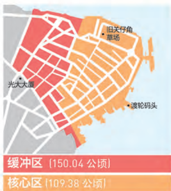
缓冲区 (150.04 公顷)