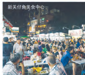
新关仔角美食中心