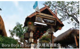
Bora Bora by Sunset 享用海鮮美食

想吃正宗當地美食的話，Belimbing Cafe Corner 是一個不錯的選擇，它以巨大網狀煎餅而聞名，你還可以選擇印度煎餅或牛油煎餅，搭配咖喱一起食用！