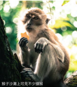
猴子沙灘上可見不少獼猴

從國家公園入口處開始有幾條徒步小徑，每條都通往不同的目的地和奇觀。第一條小徑相對容易些，向西走大約1.5小時就能到達第一站。猴子海灘的名字源自生活在附近的獼猴。你可以徒步或乘船抵達海灘，海灘風景宜人，邊上也有不少攤販售賣飲料和小吃，還能體驗水上運動或者是沙灘車騎乘。