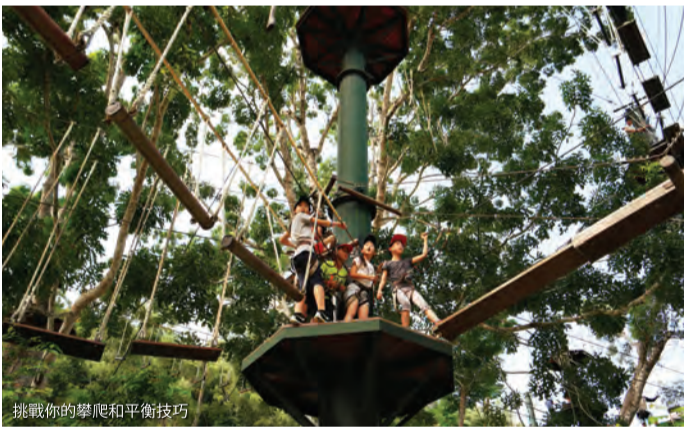
挑戰你的腳底和平衡技巧

尋找刺激的冒險和腎上腺素飆升的快感！來逃生冒險樂園感受這一切，這裡有著各種驚險刺激的冒險挑戰，更不要錯過搭乘全世界最長滑水道的機會！它打破了吉尼斯世界紀錄，全長1111米！你會穿梭過叢林樹梢，遊走在各種曲折和轉彎，體驗讓人心驚肉跳的4分鐘滑程。