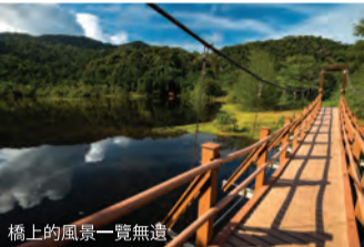
橋上的風景一覽無遺

需要攜帶的物品 大量的飲用水，也可攜帶一些零食 抓地力強的好鞋（有些小路可能很滑，尤其是最近下過雨的時候） 驅蚊劑和防雨裝備（以便在下雨時保持乾燥並保護你的貴重物品）