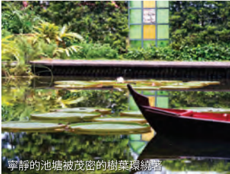
寧靜的池塘被茂密的樹葉環繞

探索夜之美 若你特別有冒險精神，可以提前預約參與每月第二和第四個周六晚上的夜行活動。在那裡你可以深入地瞭解花園夜間的一面。孩子們則可以通過各種自然教育項目，學習自然知識。