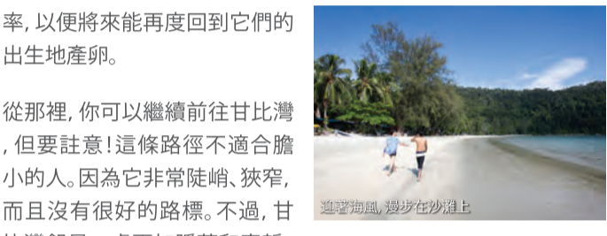
隨著海風，漫步在沙灘上

一年一度的回歸產卵 每年4月至8月，你可以看到綠蠵龜回到格拉朱海灘產卵，而橙蠵龜則是在9月至2月期間回歸產卵。