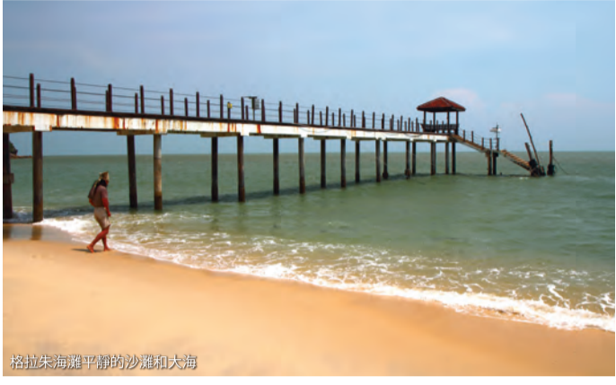
招格拉朱海灣平靜的沙灘和大海