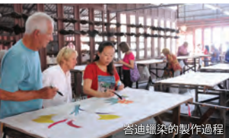
蠟染蠟染的製作過程

想要了解蠟染文化？請來參觀檳城蠟染工廠，參加每日免費的導覽遊，參觀藝術館、精品店，還可以到蠟染工廠了解手工繪製、手工雕版和手工印花是如何生產出來的。有別於一般的單面印刷，這裏的每一塊織物都是獨一無二的，因為它的兩面都有獨特的圖案和顏色。