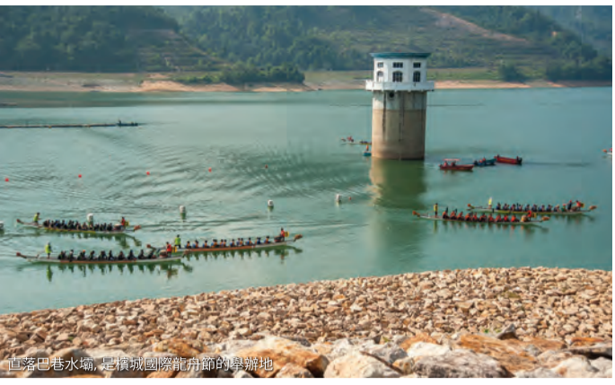
直落巴巷水壩，是傳統國際龍舟節的舉辦地

作為檳城最大的水壩，直落巴巷水壩是作為替代水源而建造的。從它的頂峰，你可以欣賞到檳島北部海岸的景色。水壩的高度和長度分別為58.5米和685米，壩頂厚達12米，可以沿著壩頂修建公路。