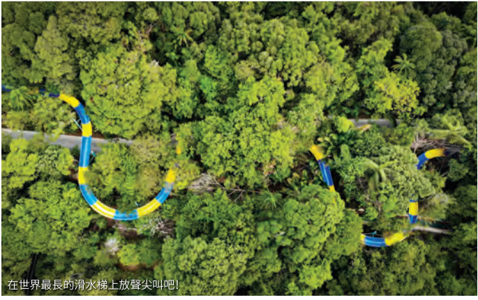
在世界最長的滑水道上放鬆尖叫吧！

尋找刺激的冒險和腎上腺素飆升的快感！來逃生冒險樂園感受這一切，這裡有著各種驚險刺激的冒險挑戰，更不要錯過搭乘全世界最長滑水道的機會！它打破了吉尼斯世界紀錄，全長1111米！你會穿梭過叢林樹梢，遊走在各種曲折和轉彎，體驗讓人心驚肉跳的4分鐘滑程。