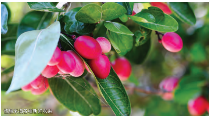
遠眺來訪各種新鮮水果

熱帶果園是一個占地25英畝的有機果園，裡頭有超過250種營養豐富的熱帶和亞熱帶水果。每天0900-1700，會定期進行為時30分鐘的果園導覽（可選擇英語或中文）。參觀結束後，你就可以放松心情，欣賞壯麗的景色，同時品嚐各種鮮切水果和果汁。此外，若事先預訂，園方將提供午餐和晚餐自助餐，以及免費提供水果。