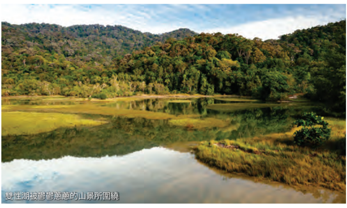
悠遊海龜世界遼闊的山景所圍繞

如果你是藝術愛好者，那一定要參訪 Art & Garden！這個花園裡收集了大量的植物、雕塑還有藝術裝置。值得一提的是，當地和國際藝術家創作的戶外壁畫、陶瓷、馬賽克和錦鯉池等創意作品都點綴在這個花園中，還可遠眺欣賞升旗山。