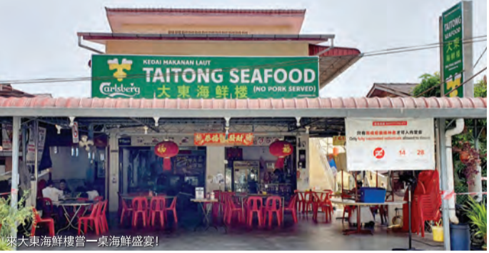
位於大東海鮮餐館——一場海鮮盛宴！

作為一個漁村，直落巴巷被許多人譽為一個充滿新鮮和令人垂涎的海鮮寶地。作為其中一家好評不斷的海鮮餐廳，它會提供盆子讓客人親手挑選活海鮮現場烹飪他們的菜肴，沒有比這更新鮮的食物了。