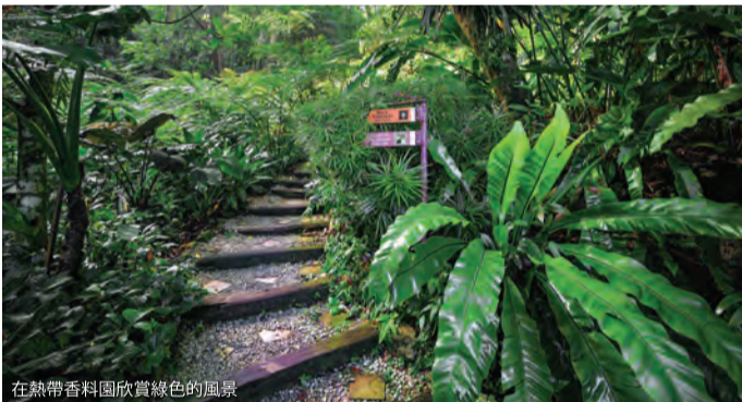
在熱帶香料園欣賞綠色的風景