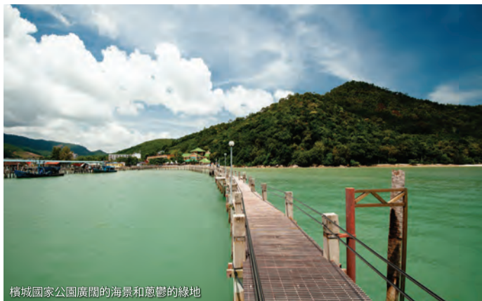
檳城國家公園廣闊的海景和蔥鬱的綠地

檳城國家公園充滿了許多蓬勃發展的動植物物種，是一個自然奇觀的寶庫，包括沿海山地二元結構、紅樹林、海灘和巖石海岸。這裡有很多途徑可以觀察和拍攝鳥類和森林動物在其自然棲息地的情況。有如此廣泛的活動，你絕對不會感到無聊！