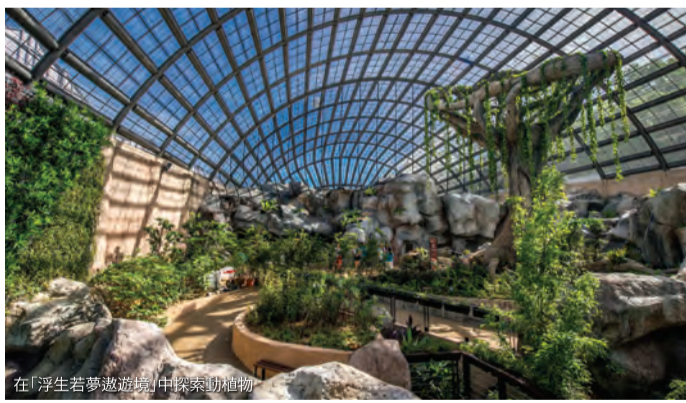
在「浮生若夢遨遊境」的熱帶植物園

翻飛蝶群 想在自然環境中觀看翻翻起舞的蝴蝶嗎？那你一定要探訪蟲鳴大地蝴蝶公園的戶外生態園「浮生若夢遨遊境」。生態園內有一座全馬最大的蝴蝶園，你可以目睹同時有1萬5千只蝴蝶在園內翻飛的景象！