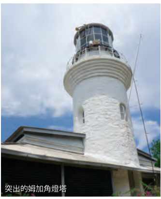
突出的姆加角燈塔

從那裡，你可以選擇再徒步行40分鐘，前往姆加角燈塔。它被稱為檳城的三個地標性燈塔之一，是在19世紀80年代由英國政府建造的，作為對來往船隻的指引。從0900-1500，你可以走上燈塔上一條對外開放的樓梯，它一直盤旋至這座突出的白色花崗巖塔頂，從這裡可以欣賞到峇都丁宜和檳仁灣的碧藍色大海，景色令人心曠神怡！