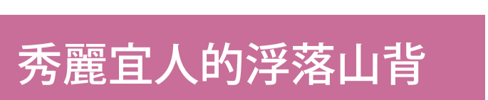
在檳樹叢中的精緻餐飲

除了直落巴巷，你還可以到鄰近的峇都丁宜旅遊，那邊有許多美食選擇，其中包括 Ferringhi Garden 的西餐和海鮮、Grand Lebanon 的中東美食、Andrew's Kampung 的馬來西亞風格料理、Bora Bora by Sunset 的本地和西餐、酒水和非酒精飲料等等。