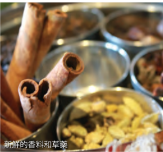
新鮮的香料和草藥

喜聞香料的人，檳城熱帶香料園會是你的天堂！它是東南亞唯一獲獎的熱帶花園，占地超過8英畝的二級叢林，擁有超過500種熱帶動植物。熱帶香料園曾經是一個廢棄的橡膠種植園，直到它的創始人把改造變成了一個具有舒緩、且充滿禪意的熱帶天堂。即便你不想只局限於在香料園裡散步，園區裡還有很多其他活動可以參加。