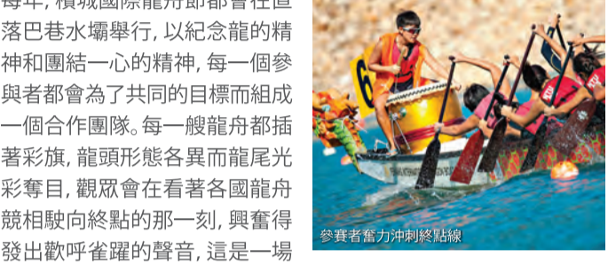
參賽者奮力沖刺終點線

作為檳城最大的水壩，直落巴巷水壩是作為替代水源而建造的。從它的頂峰，你可以欣賞到檳島北部海岸的景色。水壩的高度和長度分別為58.5米和685米，壩頂厚達12米，可以沿著壩頂修建公路。