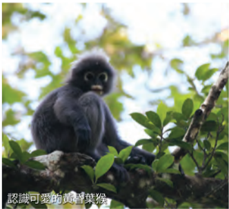
您還可以與動物親密接觸

喜聞香料的人，檳城熱帶香料園會是你的天堂！它是東南亞唯一獲獎的熱帶花園，占地超過8英畝的二級叢林，擁有超過500種熱帶動植物。熱帶香料園曾經是一個廢棄的橡膠種植園，直到它的創始人把改造變成了一個具有舒緩、且充滿禪意的熱帶天堂。即便你不想只局限於在香料園裡散步，園區裡還有很多其他活動可以參加。